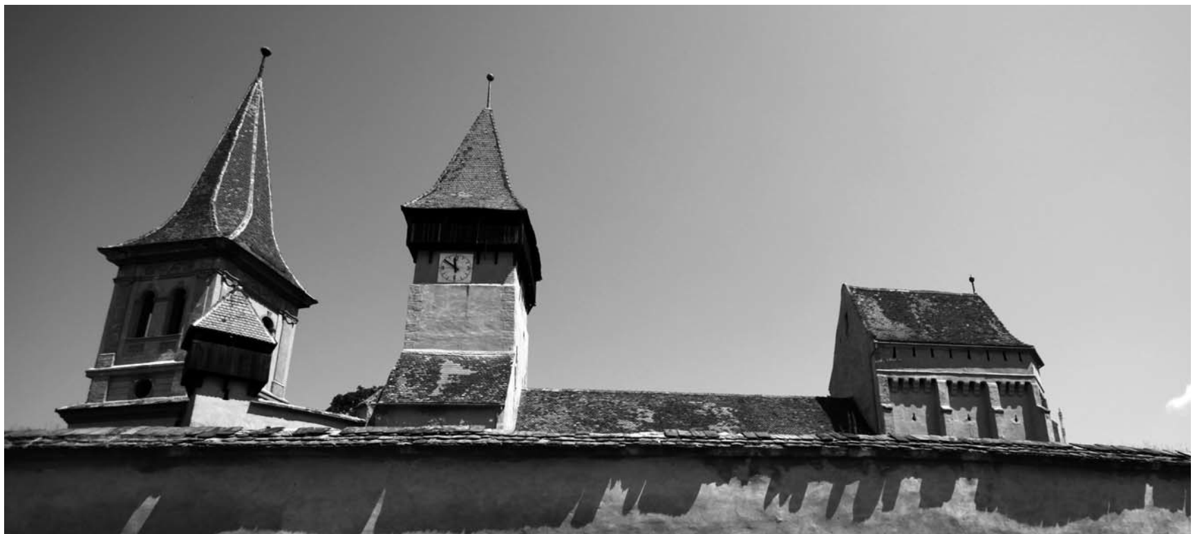
Șeica Mică, jud. Sibiu